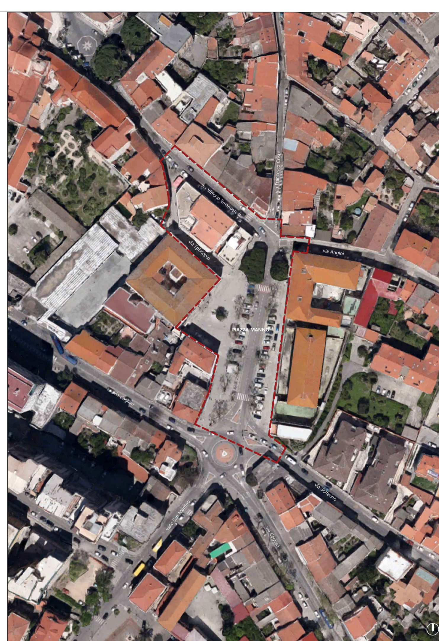
INQUADRAMENTO AREA DI PROGETTO