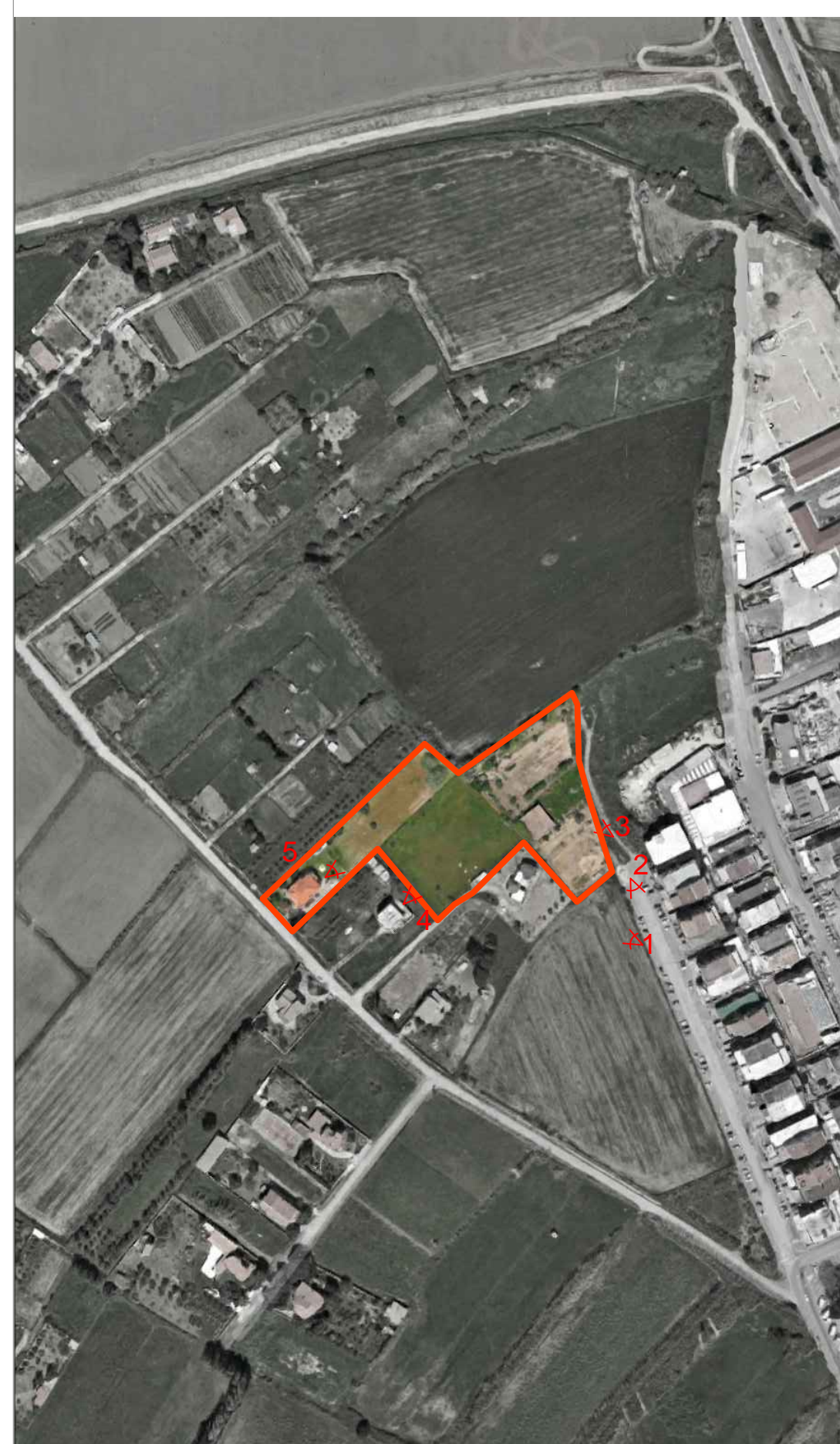
Coni ottici individuazione