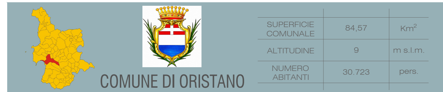
INQUADRAMENTO 4 - SILI'