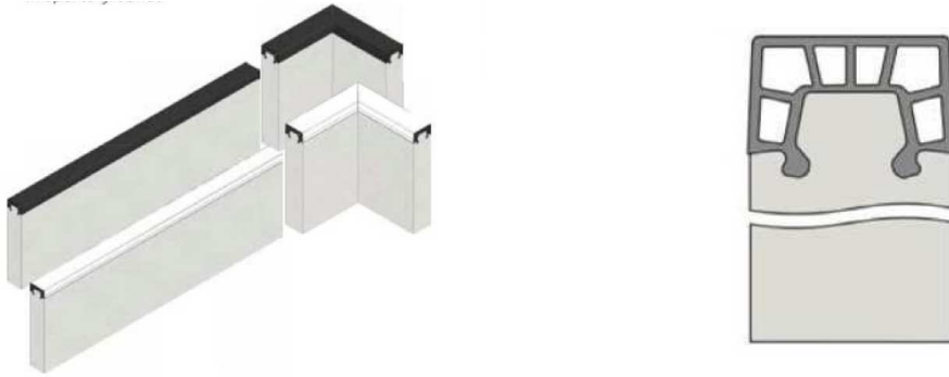
Cordolo prefabbricato in cls dotato di gomma paraurti

al fine di evitare che la sabbia possa essere trasportata dagli atleti sulla pista compromettendone la durata.