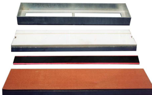
Assi di battuta per i salti in estensione .

Il progetto di completamento prevede, inoltre, il rifacimento della pedana lungo triplo per una superficie di 223 mq tramite la realizzazione delle opere di retopping nel rispetto delle modalità esecutive del progetto in corso di realizzazione e la ricostruzione della segnaletica orizzontale per la delimitazione delle corsie della medesima pedana. Quest'ultima, inoltre, sarà dotata di nuovi 6 assi di battuta per i salti in estensione (del tipo estraibile) delle dimensioni di cm 30x122.