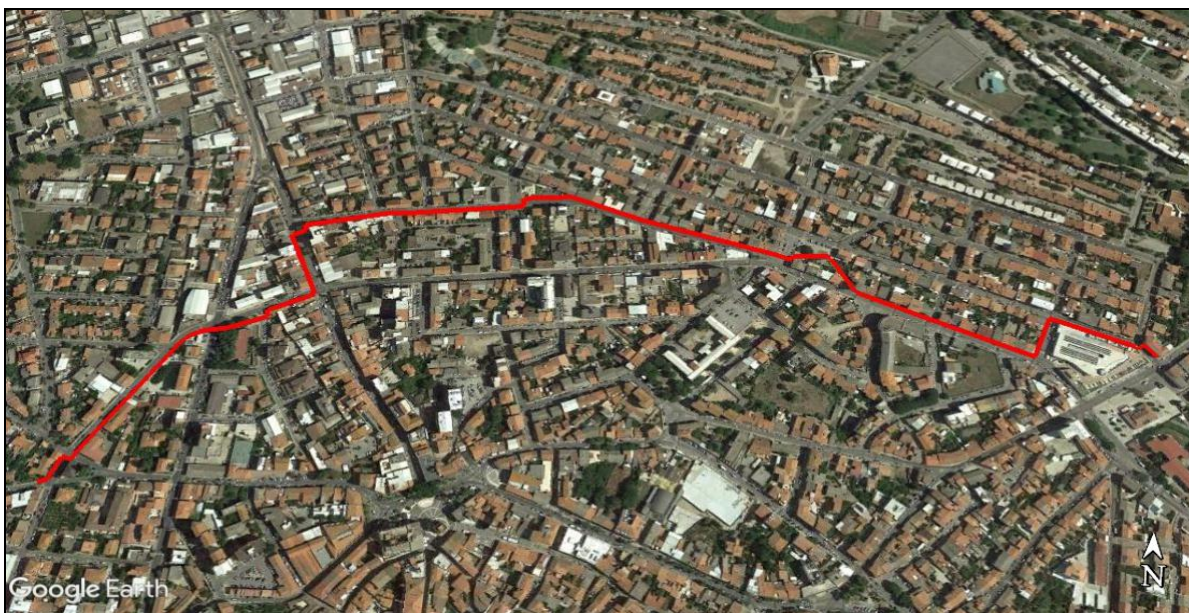
Percorso del PFTE approvato con D.G.C. n. 188/2020

d) Percorso del PFTE approvato con D.G.C. n. 188/2020