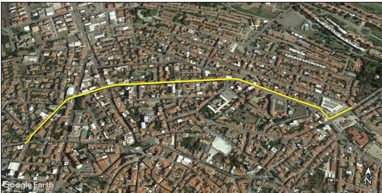
Percorso 1 di cui alla D.G.R. n. 44/33 del 2018