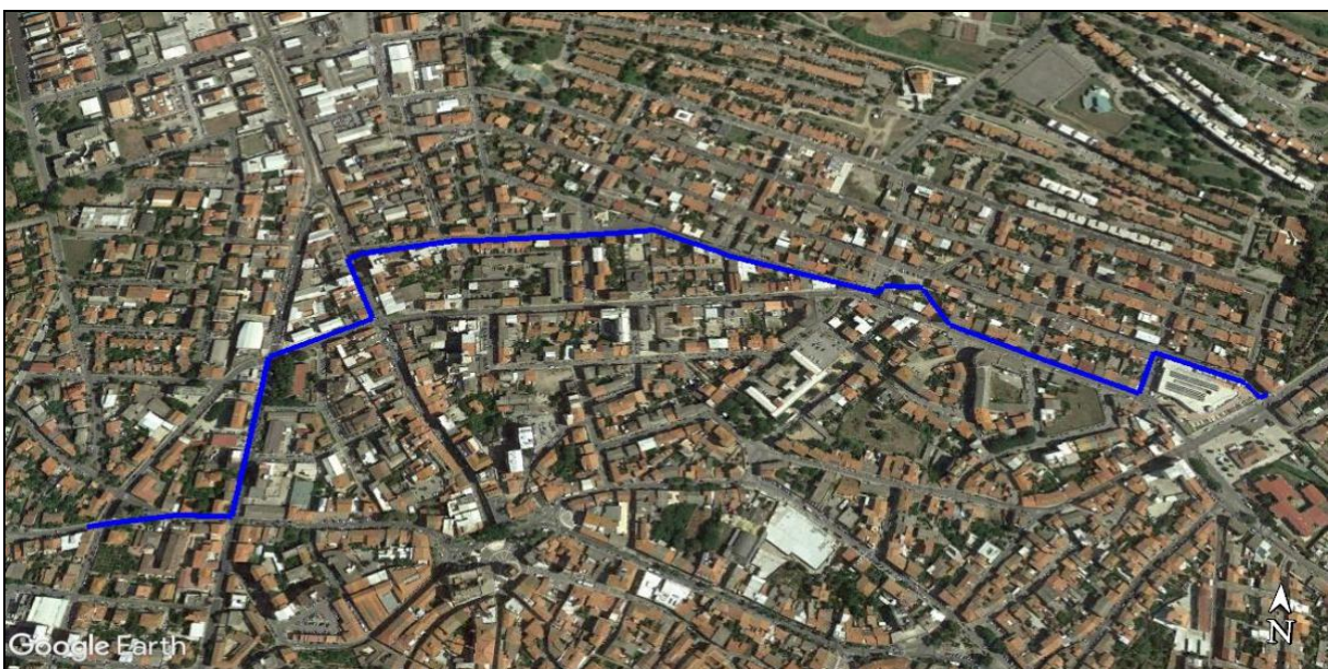
Tracciato modificato di cui scheda approvata con D.G.C. n. 244/2019