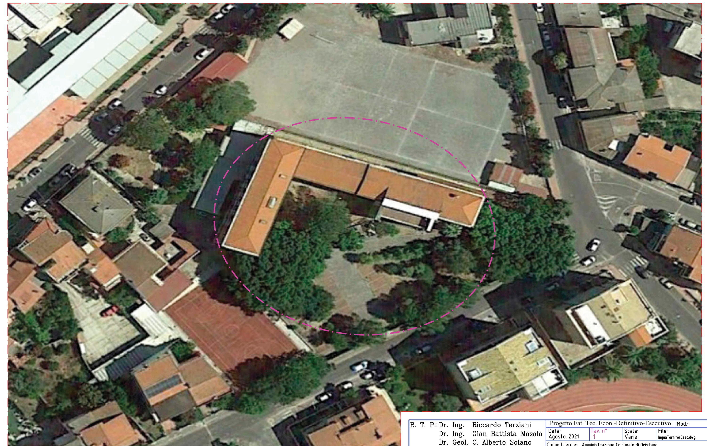
Stralcio Aerofotogrametrico - Scala 1:500