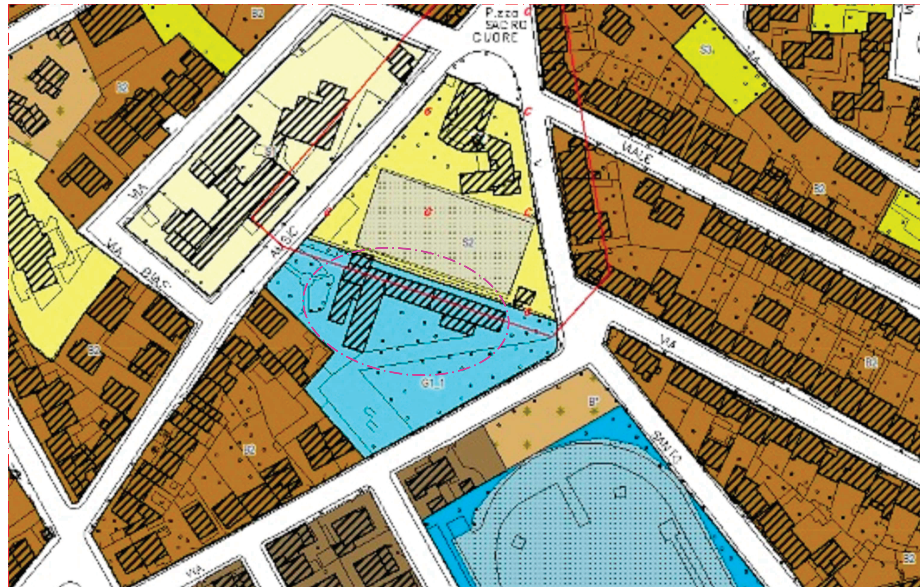
Stralcio dello Strumento Urbanistico - Scala 1:1.000