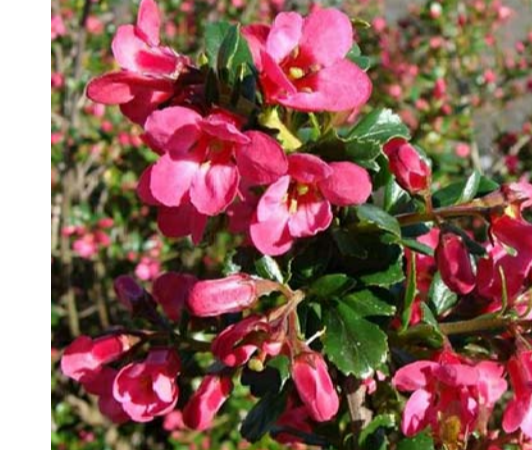
11 ESCALLONIA ROSEA