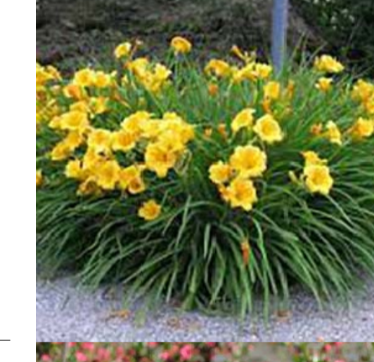
10 HEMEROCALLIS STELLA DE ORO