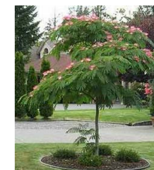
14 ALBIZIA JULIBRISSIN

Progetto fattibilità tecnica ed economica