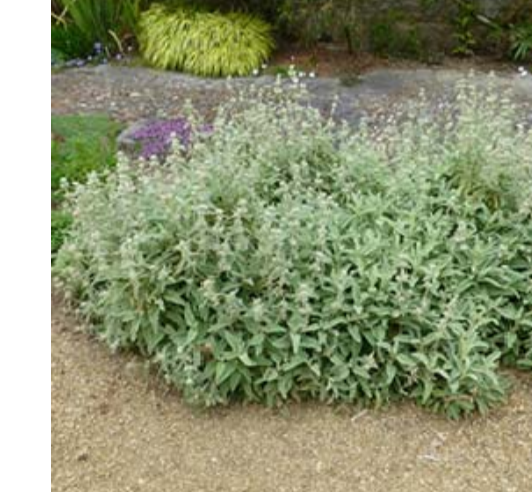
12 PHLOMIS PURPUREA / ALBA