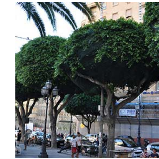
1 FICUS RETUSA