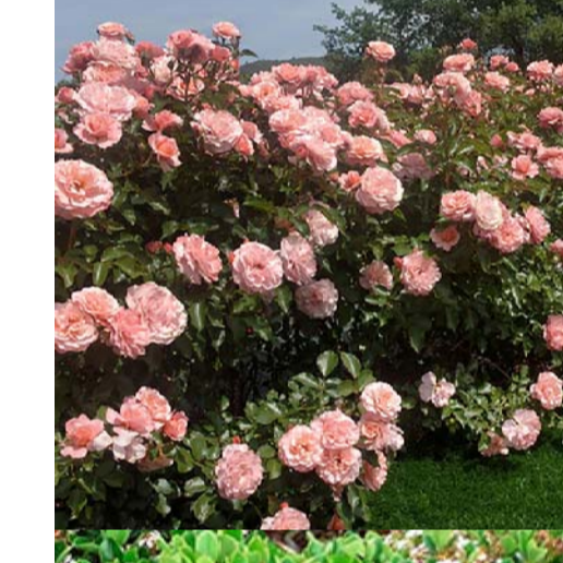
4 ROSE BONICA MELLIAND