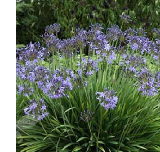
6 AGAPANTHUS UMBELLATUM