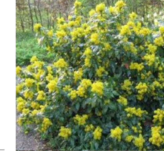
8 MAHONIA AQUIFOLIUM