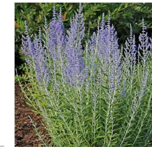
7 PEROVSKIA ATRIPLICIFOLIA