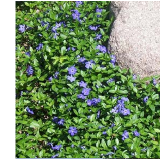
3 VINCA MAJOR (PERVINCA)