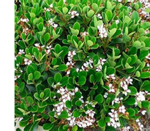
5 RAPHIOLEPIS UMBELLATA