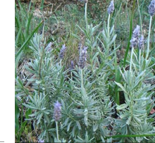
9 LAVANDULA DENTATA