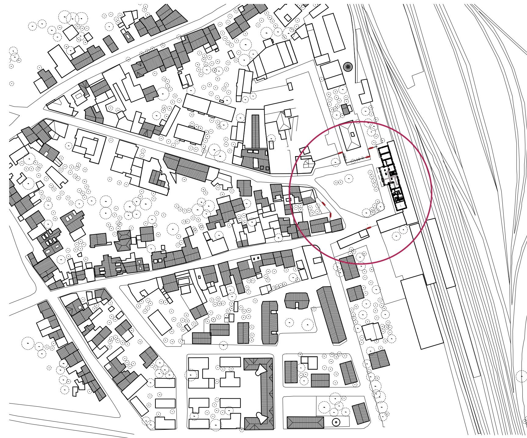
Stralcio - Aerofotogrammetrico