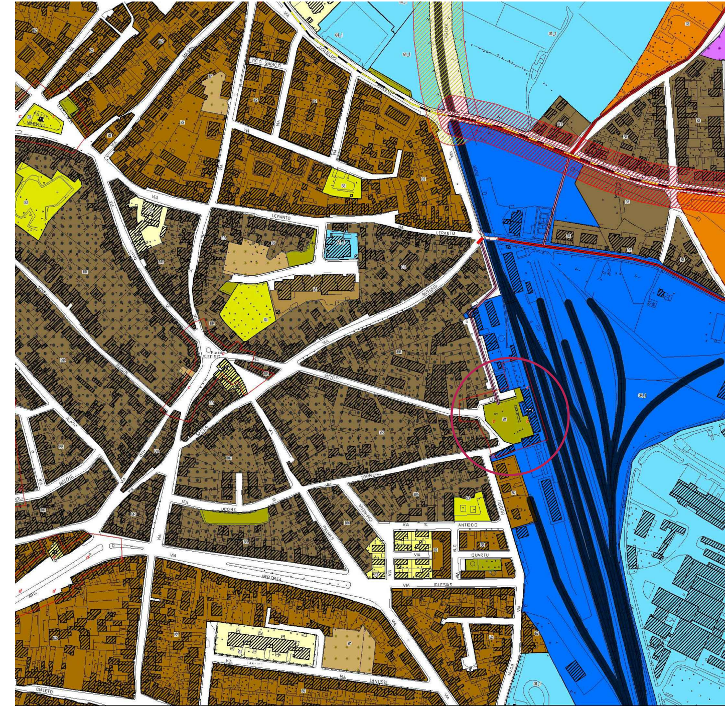
Stralcio - PUC