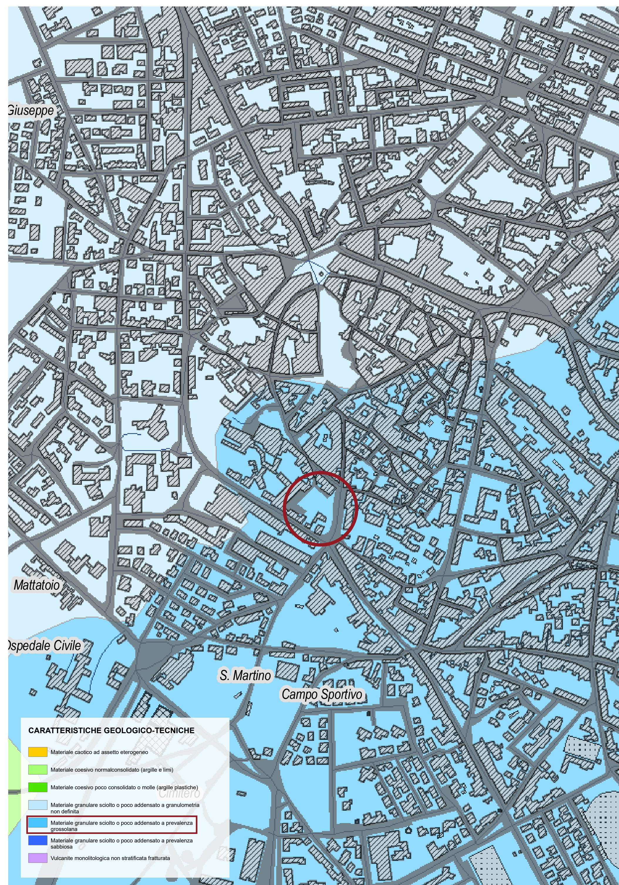
ESTRATTO P.U.C. COMUNE DI ORISTANO | TAV 03 CARTA GEOLOGICA - TECNICA