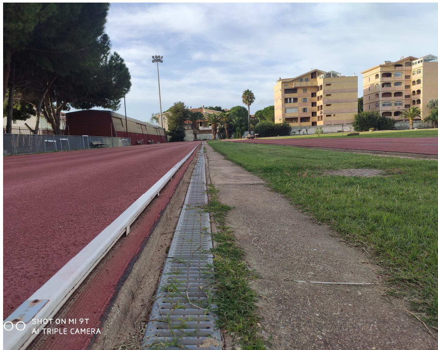
Figura 4 – particolare canaletta di raccolta ribassata rispetto alla pista/ pedane

varie pedane e il prato interno, con una media di circa 12 cm, su cui la stessa Fidal potrebbe porre, in sede di omologazione, delle condizioni di adeguamento. Vi è anche da evincere che la suddetta problematica riscontrata dal sottoscritto in sede di rilievo, non è dovuta ad un abbassamento del medesimo campo, ma risulta essere una scelta progettuale voluta in sede di ristrutturazione del campo nel 2005 (si vedano le sezioni allegata al medesimo progetto) e omologate nel medesimo periodo dalla stessa Fidal.