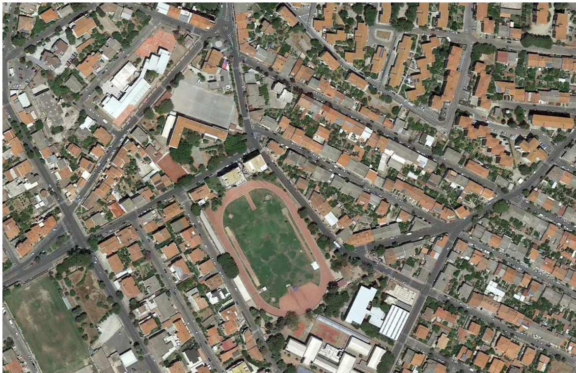
Figura 1 veduta dall'alto dell'impianto sportivo

La pista di atletica del Sacro Cuore, fa parte di un impianto sportivo ubicato a circa 1.5km dal centro e da 2.00 km dalla stazione ferroviaria.