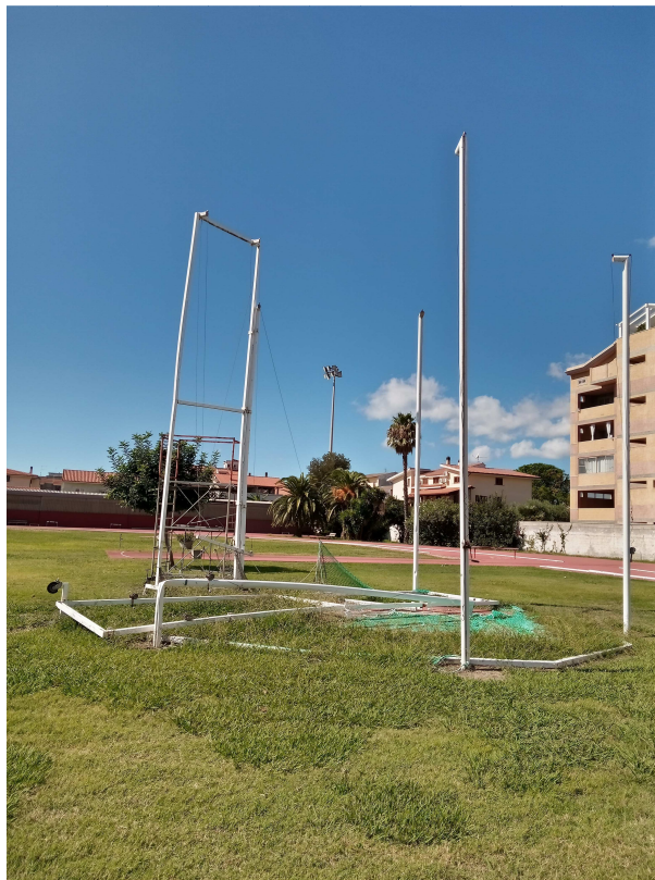
Figura 3 particolare della gabbia del martello

se non realizzate, non consentirebbero di ottenere nell'immediato un omologazione Fidal. Inoltre, sussiste un'ulteriore problematica che "potenzialmente" potrebbe essere di ostacolo ad una futura omologazione. Nella fattispecie, sussiste una lieve depressione fra le