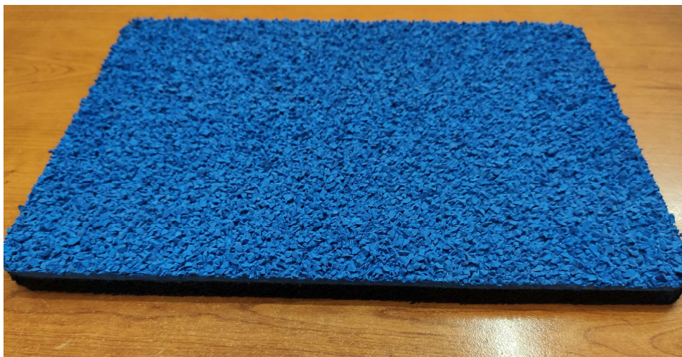
Figura 2 esempio di soluzione mista su manto prefabbricato bicolore nello spessore

L'intervento, come detto in premessa, con le somme attualmente disponibili non si potrà essere realizzato nella sua complessità; lo stesso potrà essere concretizzato per step. L'importo dei lavori a base d'asta, come si evince nel calcolo sommario della spesa, è pari a € 282.299,10 al netto degli oneri della sicurezza stimati preventivamente in € 4.000,00. Ciò implica che si rende opportuno modulare i lavori ritagliando dall'area totale da assoggettare a intervento, (paria a circa 5100 mq) , una superficie che possa essere autonoma e funzionante, (almeno per una serie di discipline legate alla corsa), per procedere in seguito a completare le altre parti.