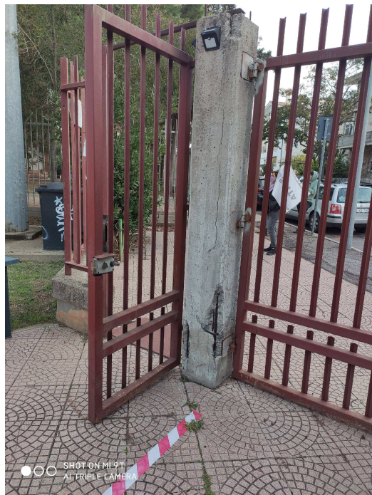
Figura 2 particolare della cancellata lato via Venezia