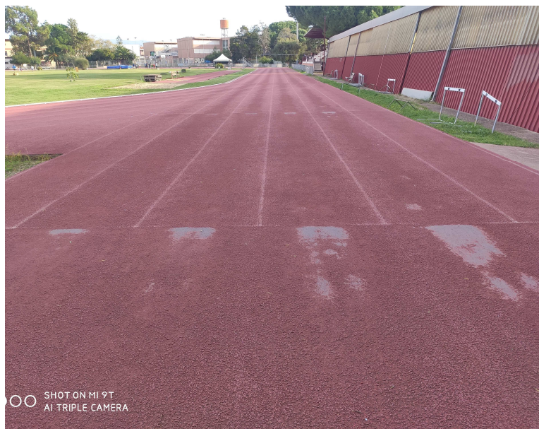
Figura 5- zone della pista maggiormente logorate

La superficie della pista, che ha un'estensione totale di circa 5.100 mq (comprese le piste laterali), è costituita da un manto prefabbricato in gomma colore rosso, (manto sintetico prodotto dalla ditta Mondo calandrato e vulcanizzato struttura a celle chiuse in gomma poliisoprenica costituita da teli prefabbricati in opera con adesivi a base di resine poliuretatiche incollato su manto bituminoso dello spessore cm 6+3), e presenta un forte stato di usura conseguenza del tempo trascorso e del processo di cristallizzazione soprattutto nelle corsie interne e/o nelle zone più sollecitate.