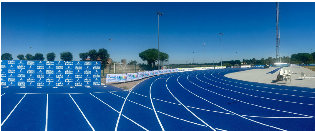
Figura 1 esempio di intervento di retopping.

Visto quanto indicato nella relazione illustrativa, si evince chiaramente che le varie soluzioni che si potrebbero realizzare hanno tutte un comune denominatore ossia il trattamento preventivo del manto esistente. Quest'ultimo, previa la realizzazione di opportune lavorazioni di smerigliatura propedeutiche alle successive stesure, sarà la base di appoggio dei lavori di Retopping che si dovranno prevedere sulla pista esistente. Altro denominatore comune a tutte le lavorazioni prevedibili è che le stesse, dovranno essere realizzate nel rispetto dei disciplinari tecnici della Fidal. Per quanto concerne le soluzioni soprastanti al manto esistente e bonificato, ossia idoneo alla stesura del retopping, la stessa Fidal riconosce, per una superficie di fascia 1, come quella che si vorrebbe realizzare, diversi possibili procedimenti applicativi a spessori variabili che oscillano fra i 4 mm e gli 8 mm .