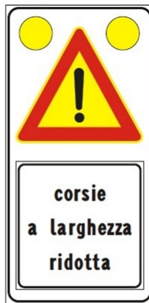
Figura II 391c Art. 31