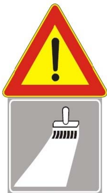
Figura II 391 Art. 31