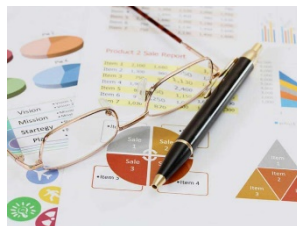
Programmazione e controllo