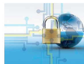
Privacy e GDPR