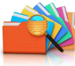
Trasparenza e anticorruzione

In questi anni di continui ed intensi cambiamenti , farePA® s.r.l. offre, ai propri clienti, un pacchetto di servizi integrati e flessibili .