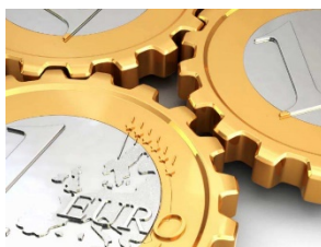
Finanza e sviluppo locale