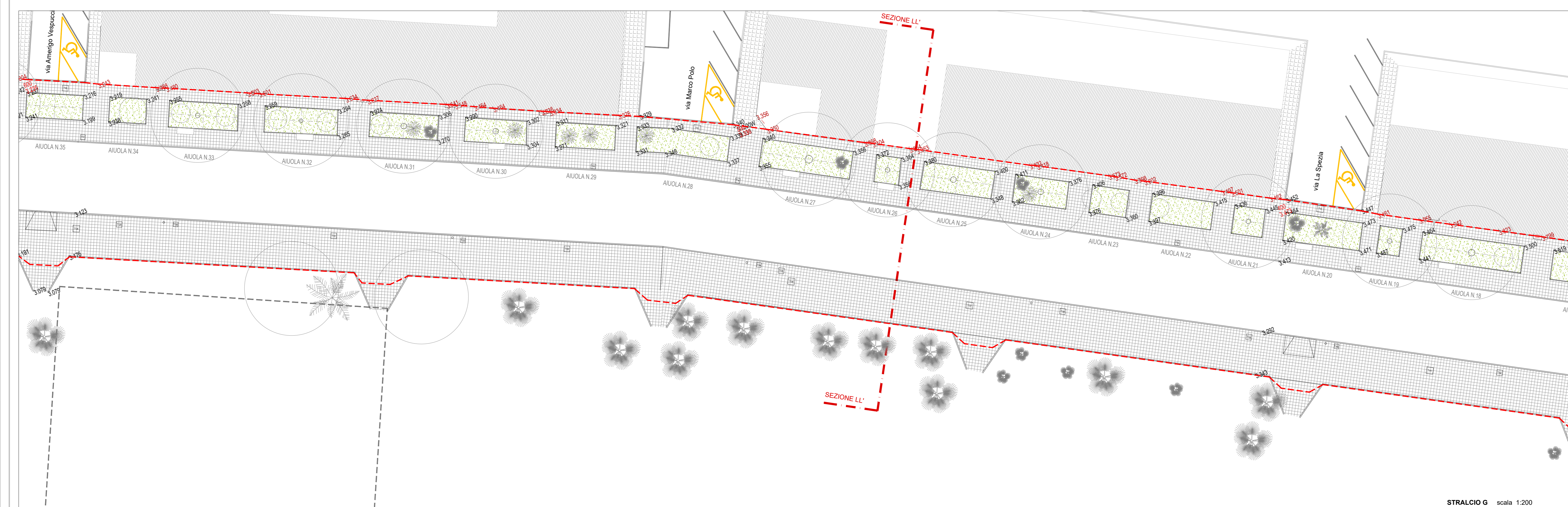
STRALCIO G scala 1:200