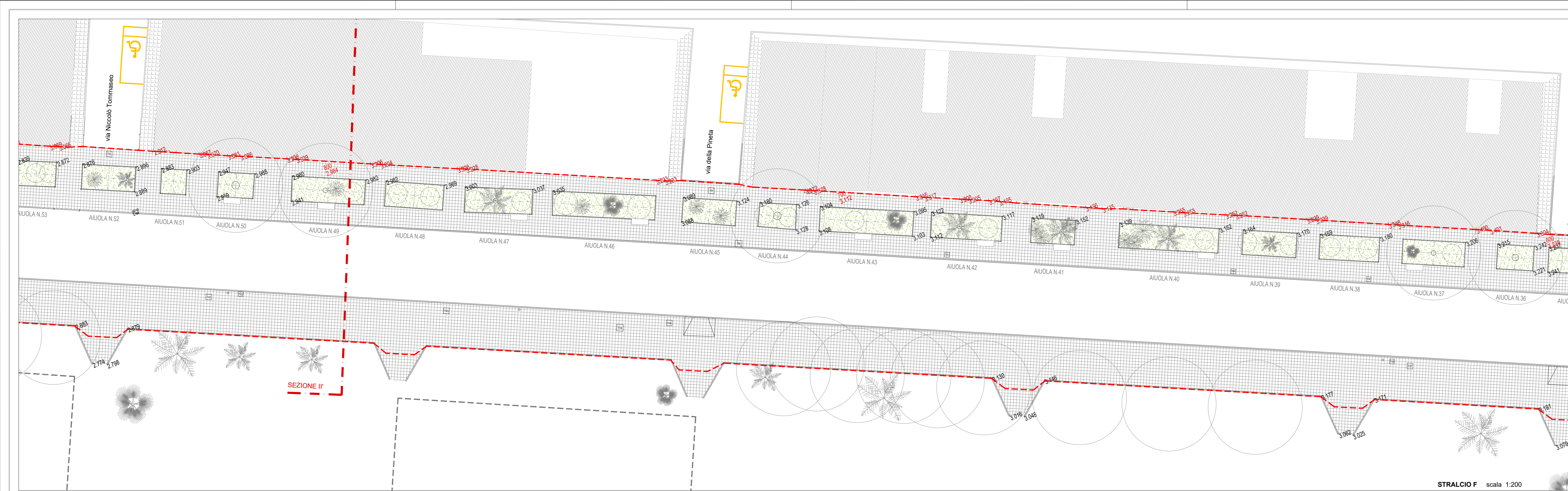
STRALCIO F scala 1:200