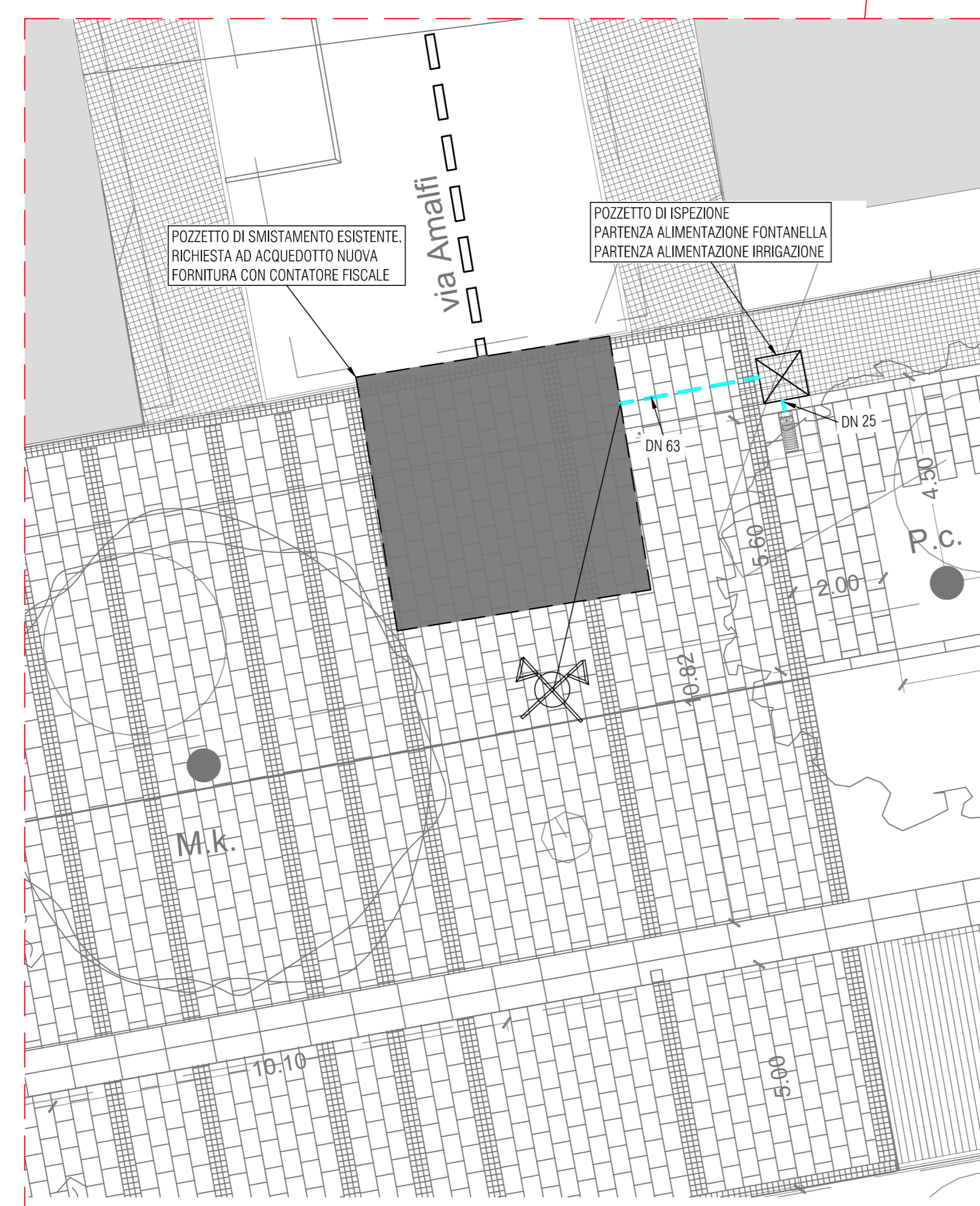
PARTICOLARE ALIMENTAZIONE FONTANELLA ED IMPIANTO IRRIGAZIONE (scala 1:100)