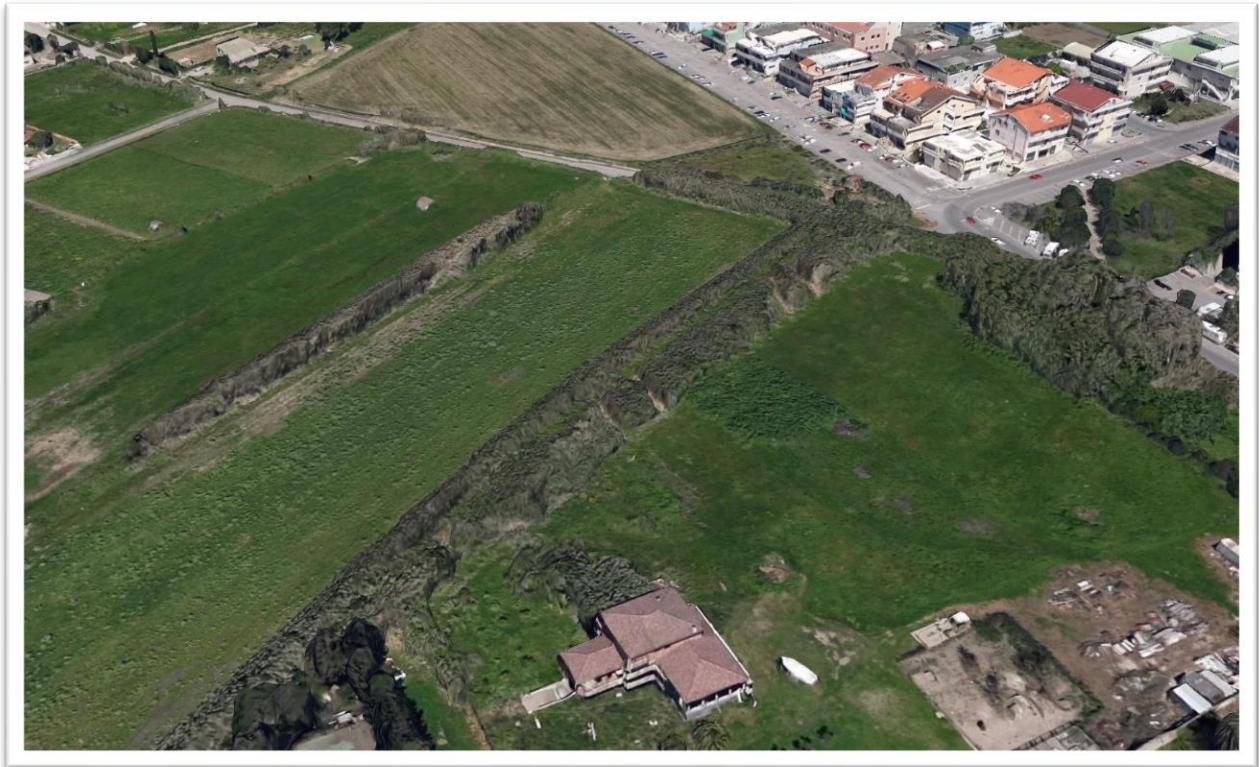
Figura 13 – Situazione prima dell'intervento