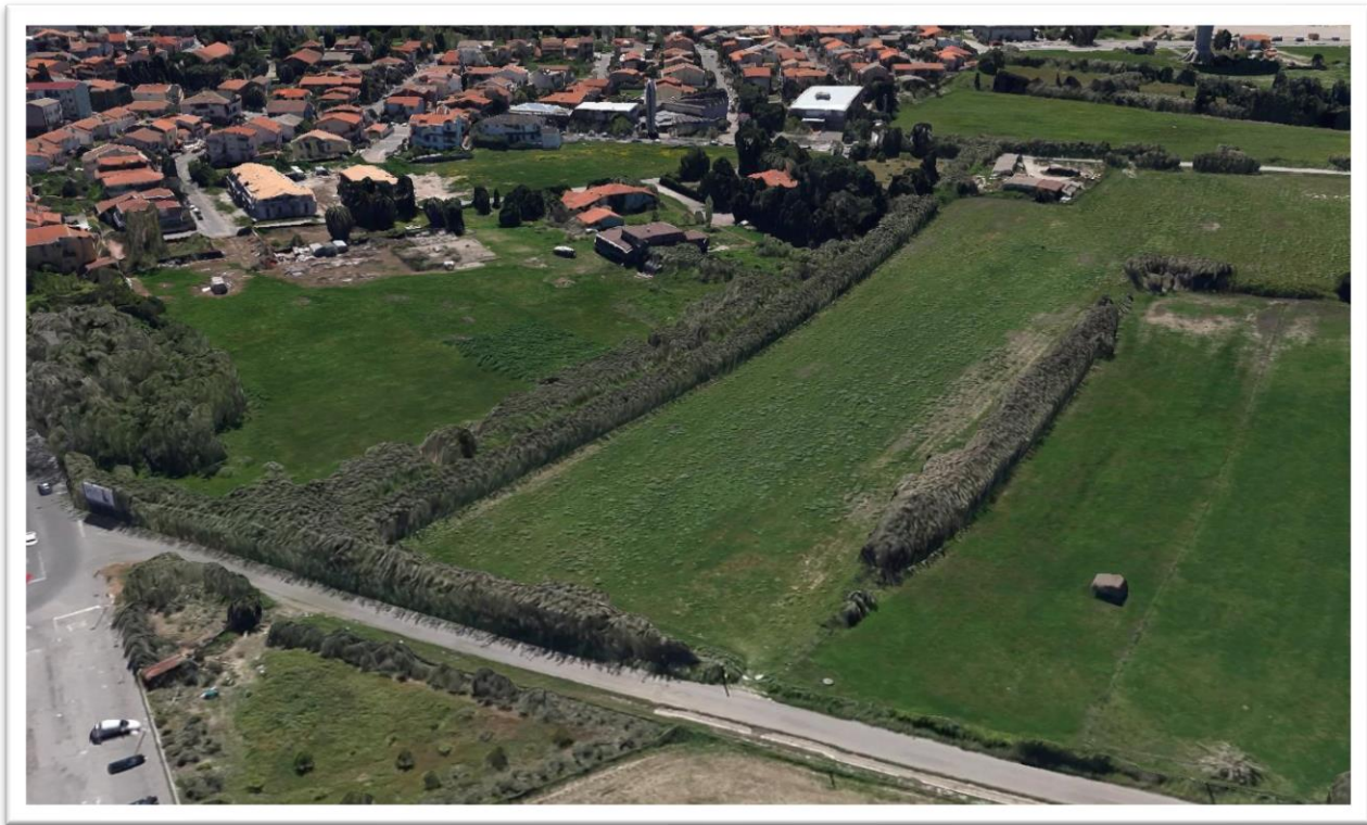
Figura 17 – Situazione prima dell'intervento