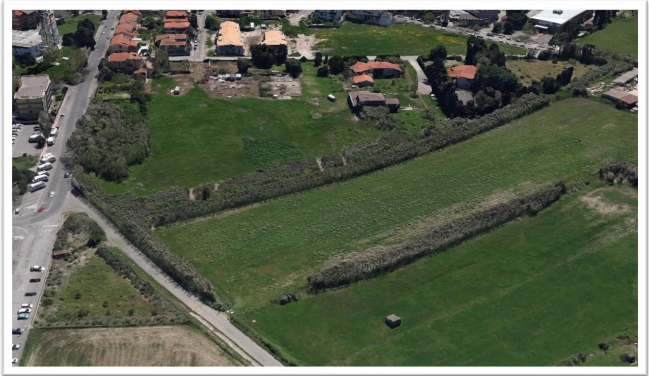
Figura 15 – Situazione prima dell'intervento