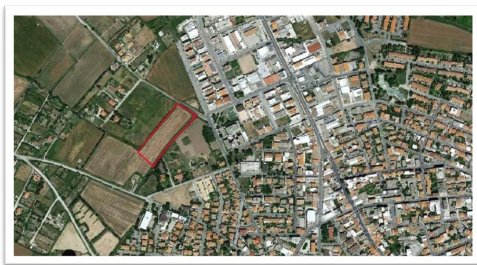
Figura 1: Vista aerea

L'area in oggetto, della superficie complessiva di mq 12.440,00 (quindi oltre il minimo consentito) s'inserisce in un contesto urbanistico decisamente antropizzato, con evidenti possibilità di sviluppo dell'intero e ben più ampio comparto C2ru, che caratterizza la vasta area prospiciente l'insediamento produttivo denominato "Cualbu".