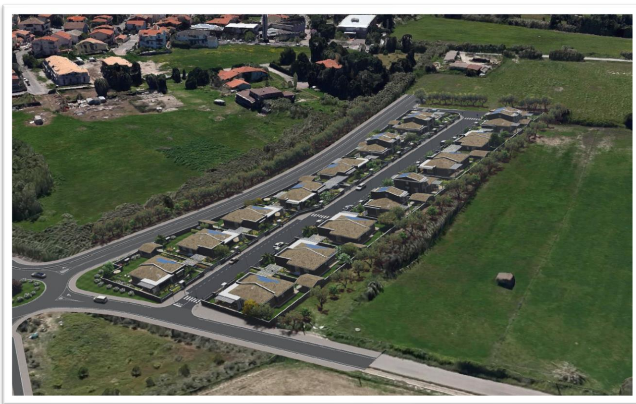
Figura 18 – Situazione post dell'intervento (con l'inserimento della circonvallazione e della rotatoria)