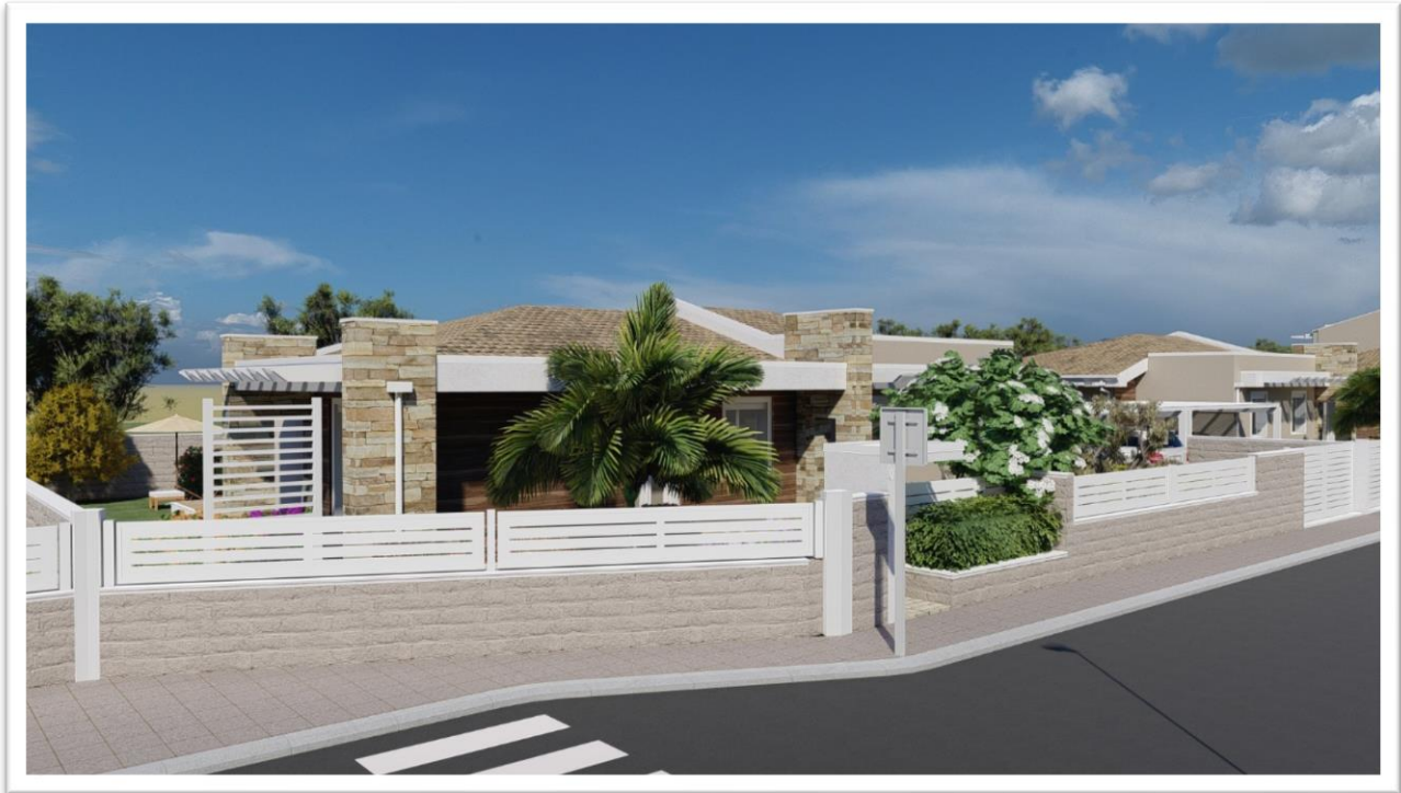
Figura 10: Lotto 07 (tipologia 1: isolata, un piano fuori terra)