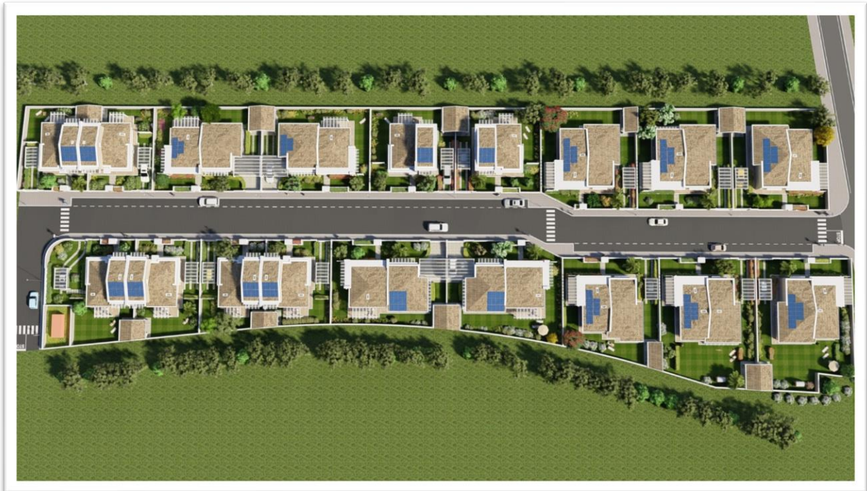
Figura 8: Vista dall'alto