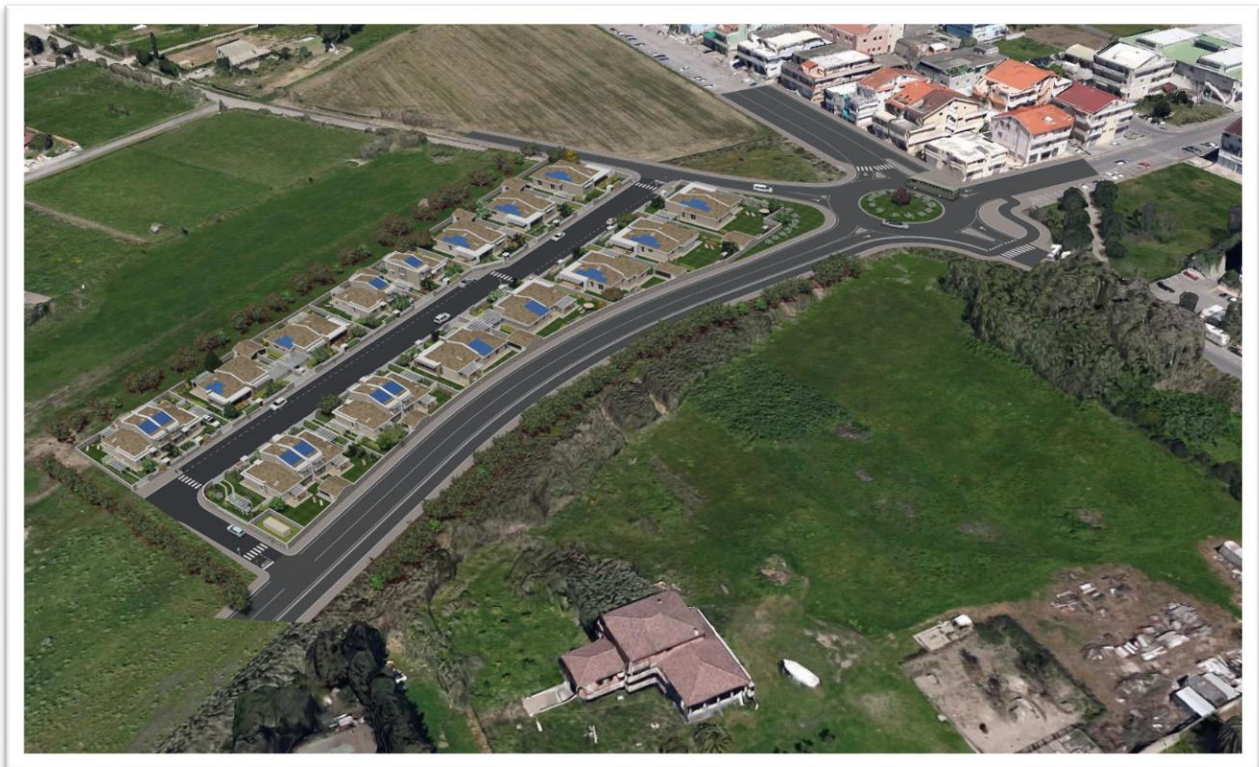
Figura 14 – Situazione post dell'intervento