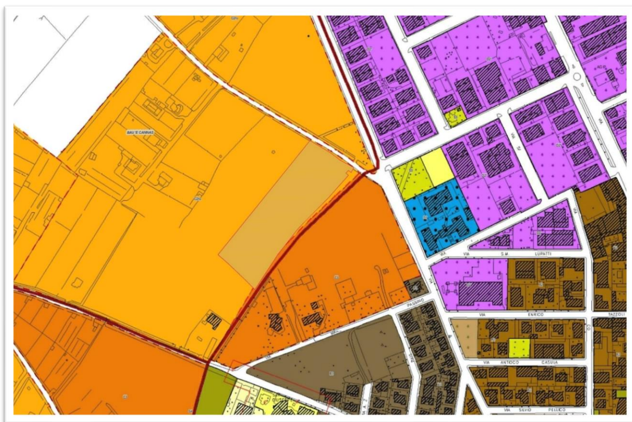
Figura 2: Stralcio Strumento Urbanistico

Presso l'ufficio urbanistico del Comune di Oristano lo stesso immobile è individuato nella C 2ru: aree antropizzate, ai limiti dell'edificato urbano che necessitano di Piani di Riqualficazione Urbanistica di iniziativa privata per essere regolamentati e inglobati nel tessuto urbano, secondo le Linee Guida di intervento che saranno approvate dal Consiglio Comunale.