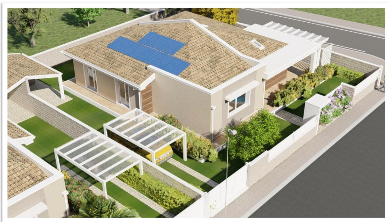
Figura 9: Lotto 02 (tipologia 1: isolata, un piano fuori terra)