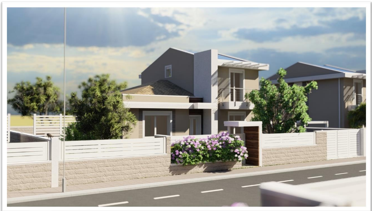
Figura 11: Lotto 10 (tipologia 2: isolata, due piani fuori terra)