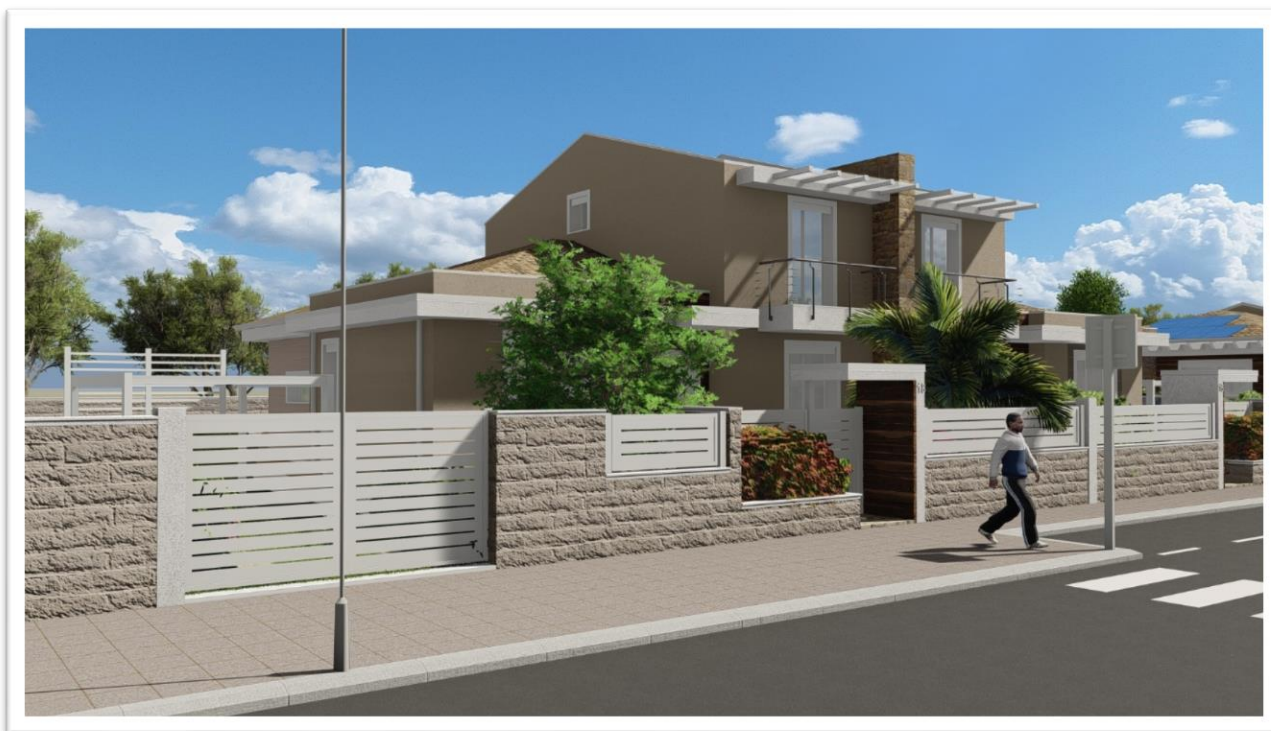
Figura 12: Lotto 18 (tipologia 3: binata, due piani fuori terra)