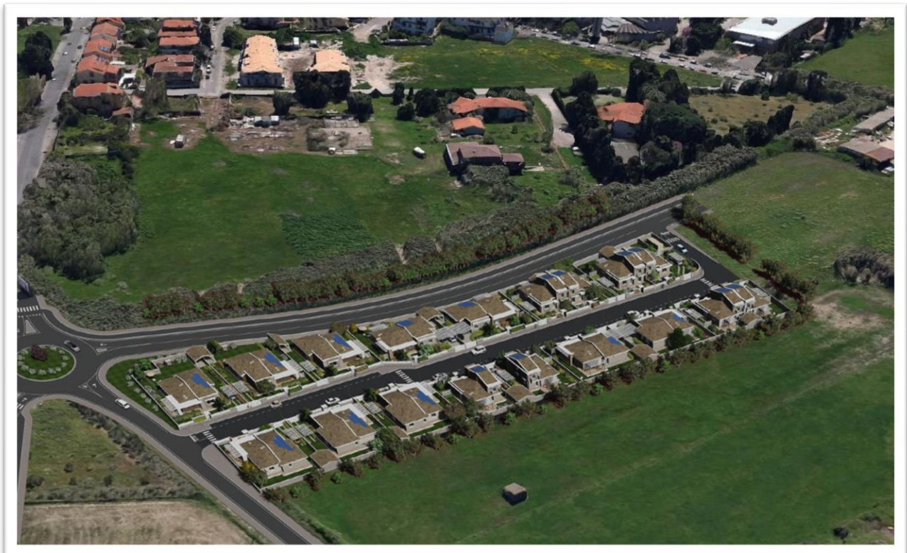
Figura 16 – Situazione post dell'intervento