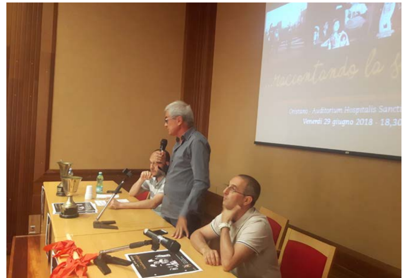
Raccontando la Sartiglia...attraverso le testimonianze della memoria