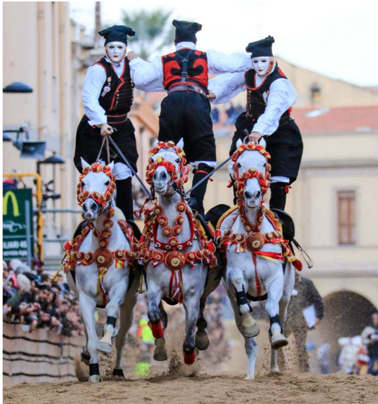
Esibizione di una pariglia in via Mazzini