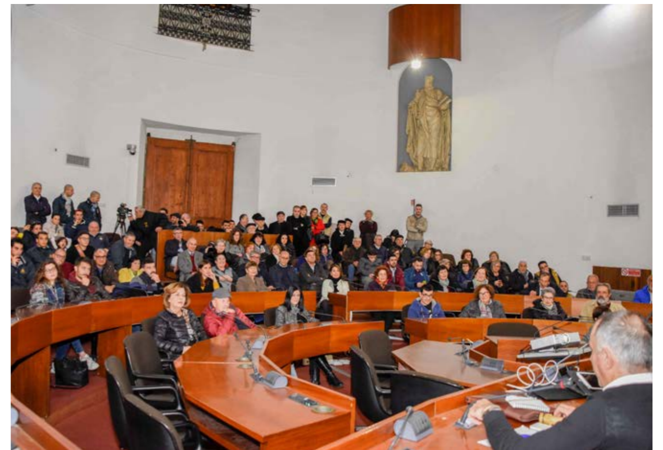
Tamburi in festa, suoni e suonatori nelle celebrazioni sacre e profane