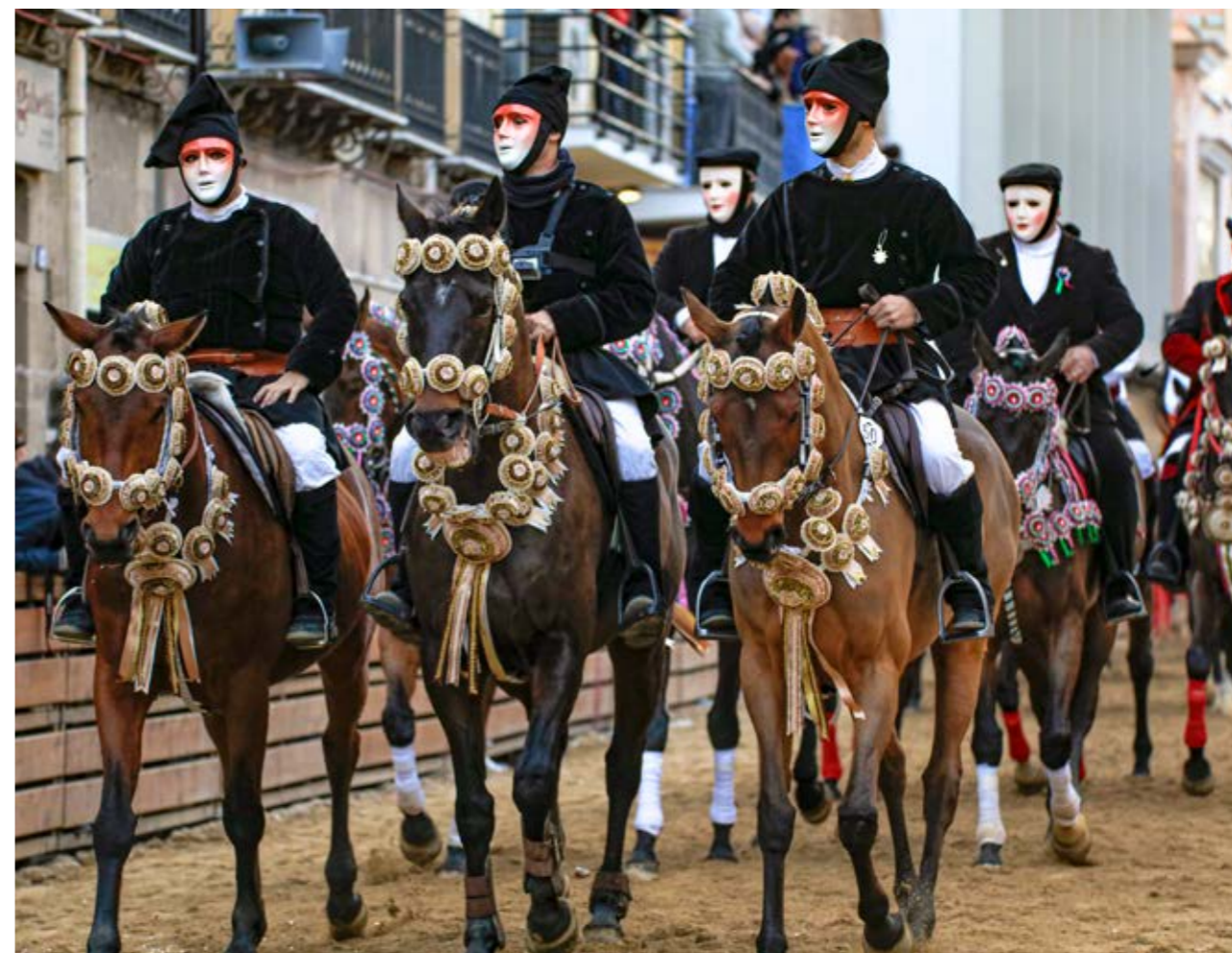
Il corteo dei cavalieri lungo la via Mazzini

L'edizione 2018 svolta l'11 e 13 febbraio ha visto, come da previsione, la partecipazione di 120 cavalieri che sotto il comando de su Componidori e la supervisione dei Gremi, hanno dato vita secondo la tradizione alle fasi salienti della Giostra: la Corsa alla Stella e la Corsa delle Pariglie. A queste fasi si sono aggiunti i riti cerimoniali, quale la Vestizione de su Componidori, che inseriscono la Sartiglia in una dimensione di fascino e mistero. La manifestazione, come sempre, ha riscosso grande successo, decretato dalla bellezza, dai colori e dai suoni che ne fanno un avvenimento unico nel panorama dei tornei equestri. Importante è stata l'attenta organizzazione curata dalla Fondazione, che oltre a garantirne la realizzazione, ha permesso al pubblico affluuto numeroso di assistere alla plurisecolare giostra equestre oristanese. Positiva come sempre la risposta all'offerta delle agenzie di viaggio e degli albergatori che hanno permesso di ospitare a Oristano un buon numero di visitatori con un ritorno apprezzabile a favore degli operatori di tutta la provincia.