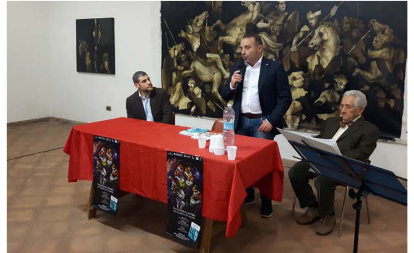
Raccontando la Sartiglia - Nei quaderni Oristanesi