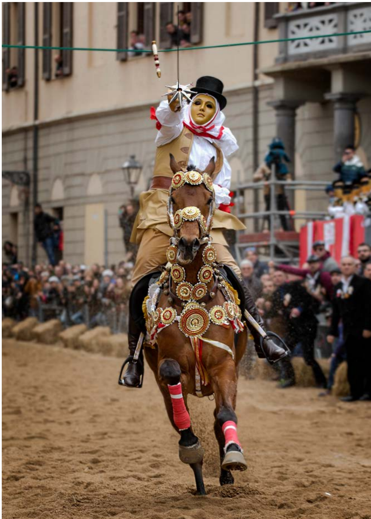
Il Componidori del Gremio di San Giovanni