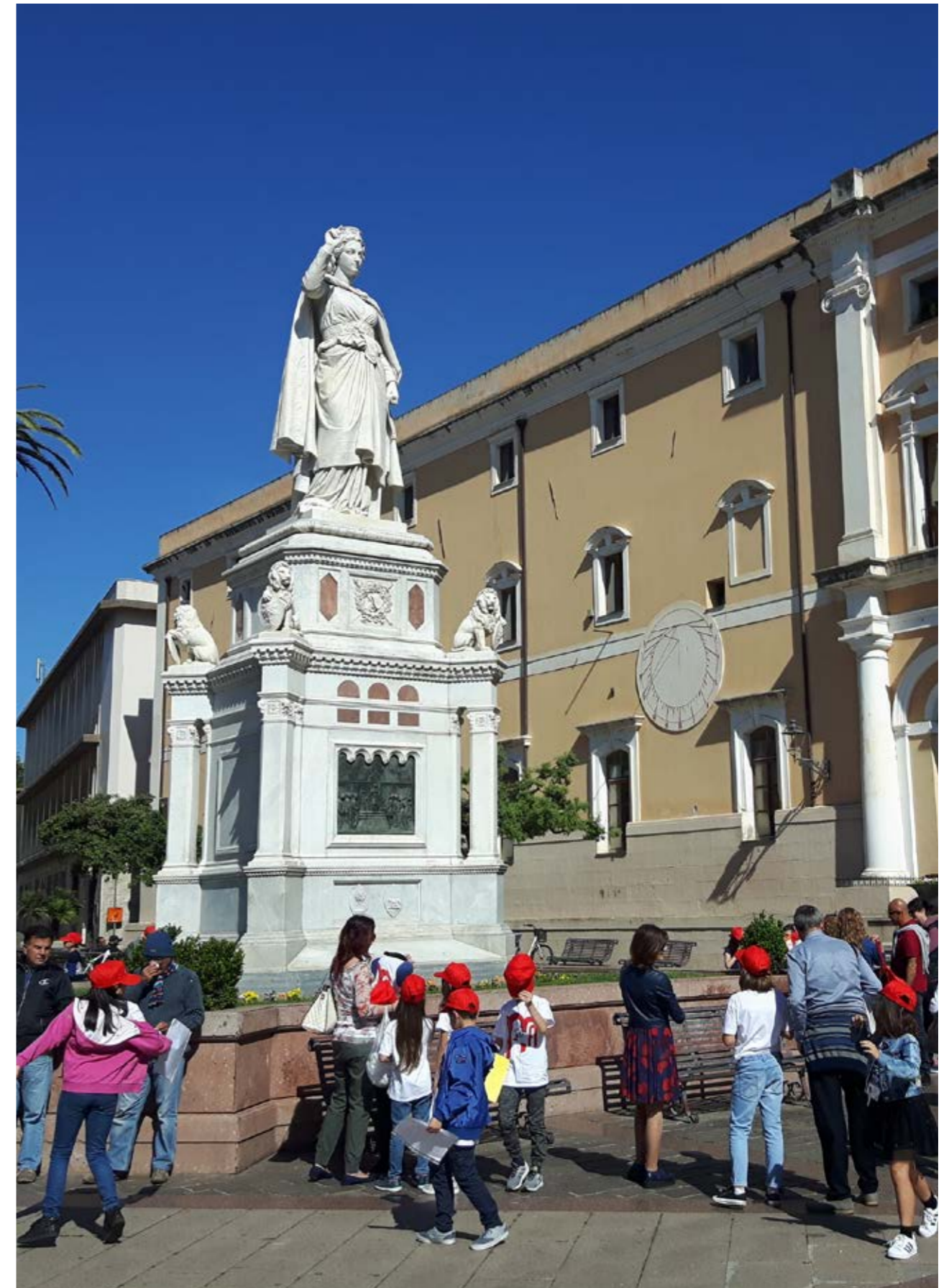
Monumenti Aperti 2018