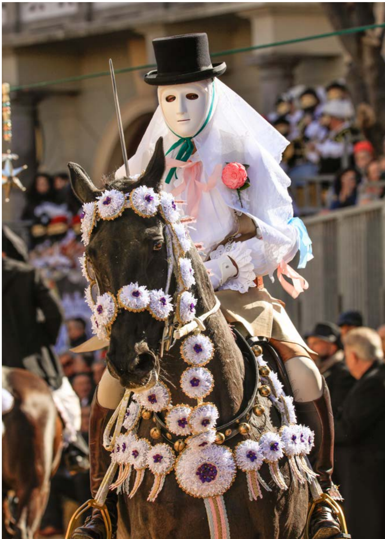
Il Comonidori del Gremio di San Giuseppe