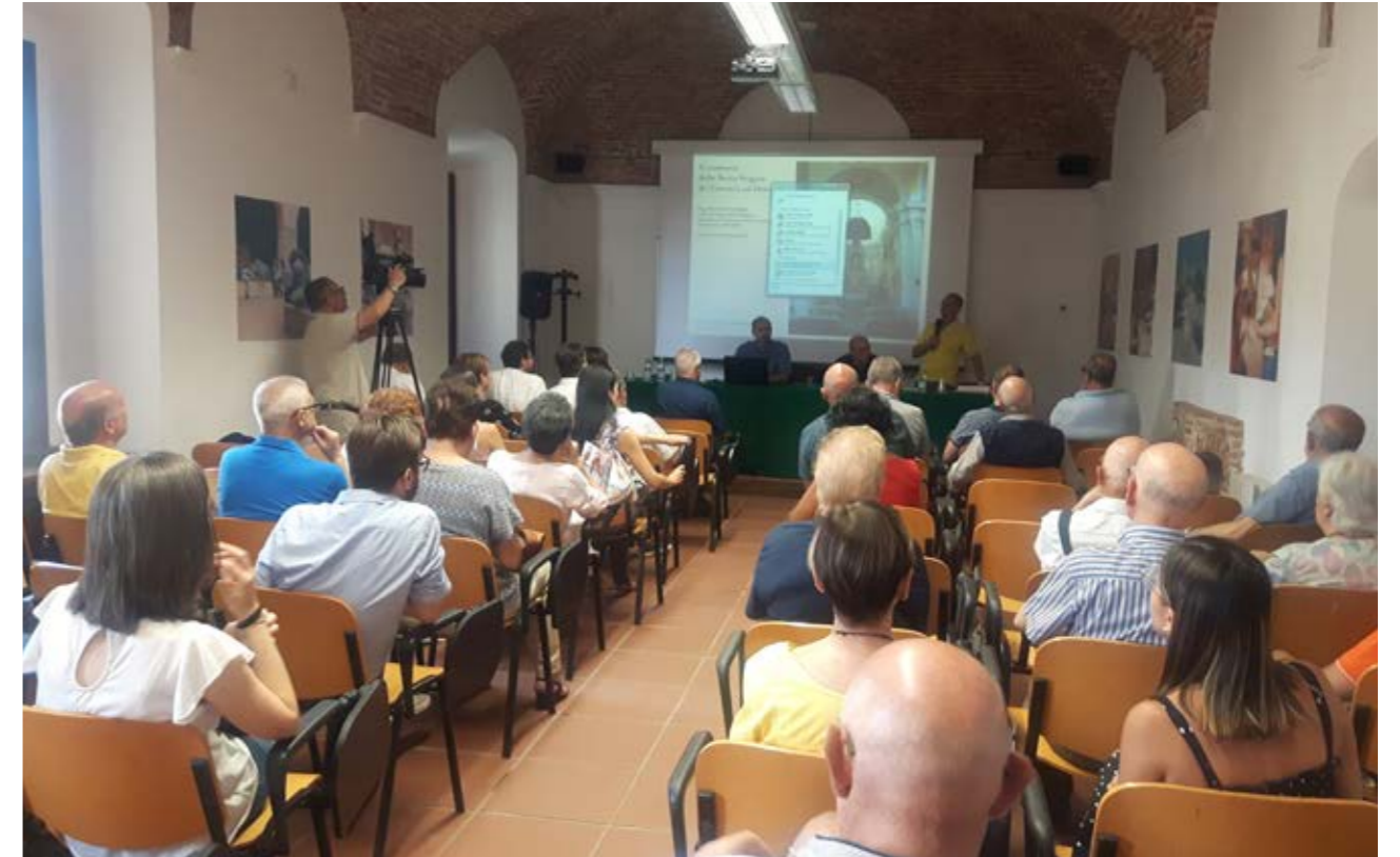
Convegno: Il convento della Beata Vergine del Carmelo di Oristano