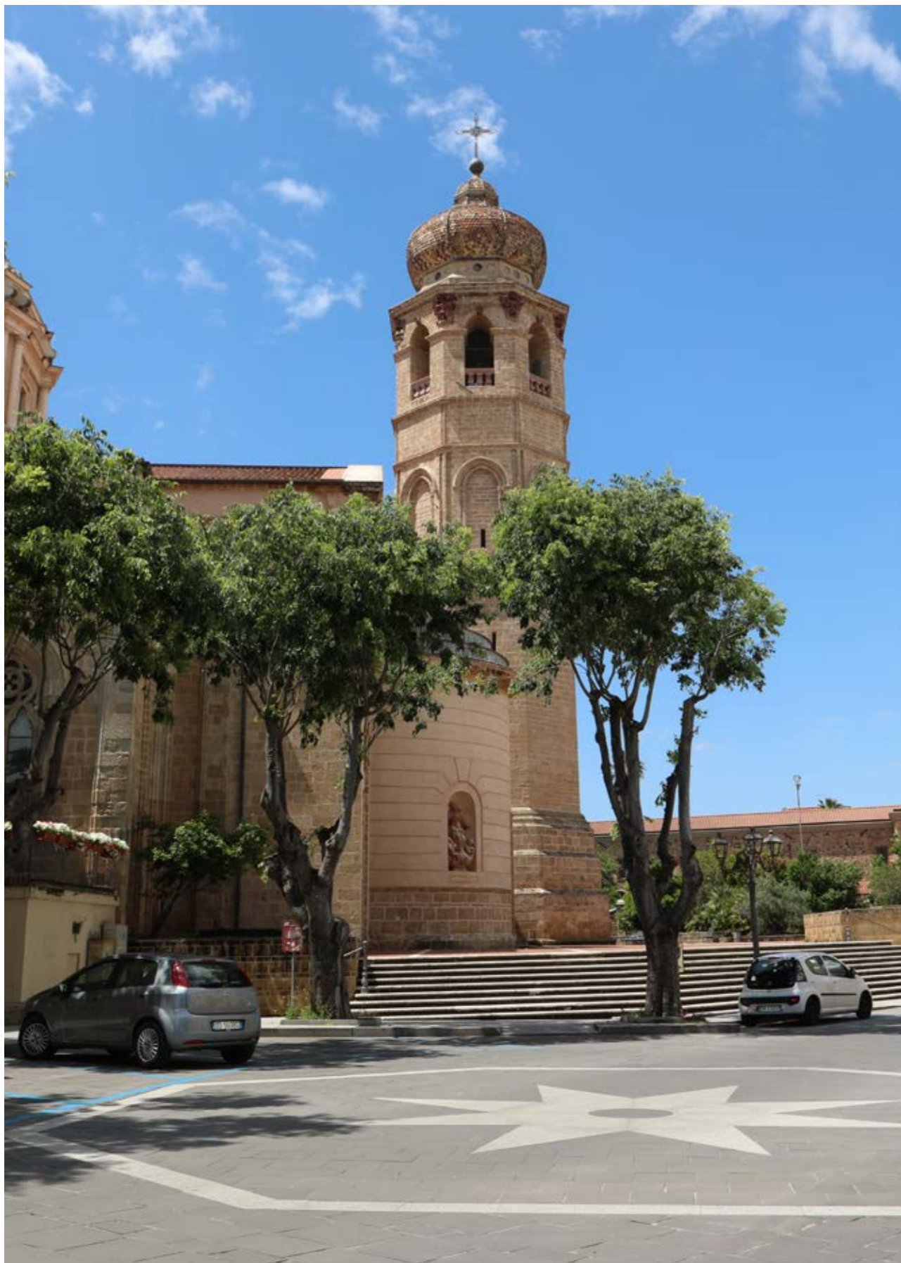
La Cattedrale di Santa Maria Assunta