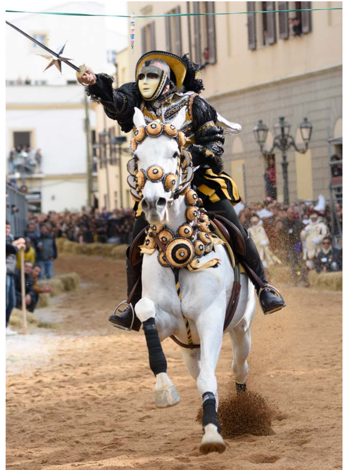
Discesa alla stella in via Duomo