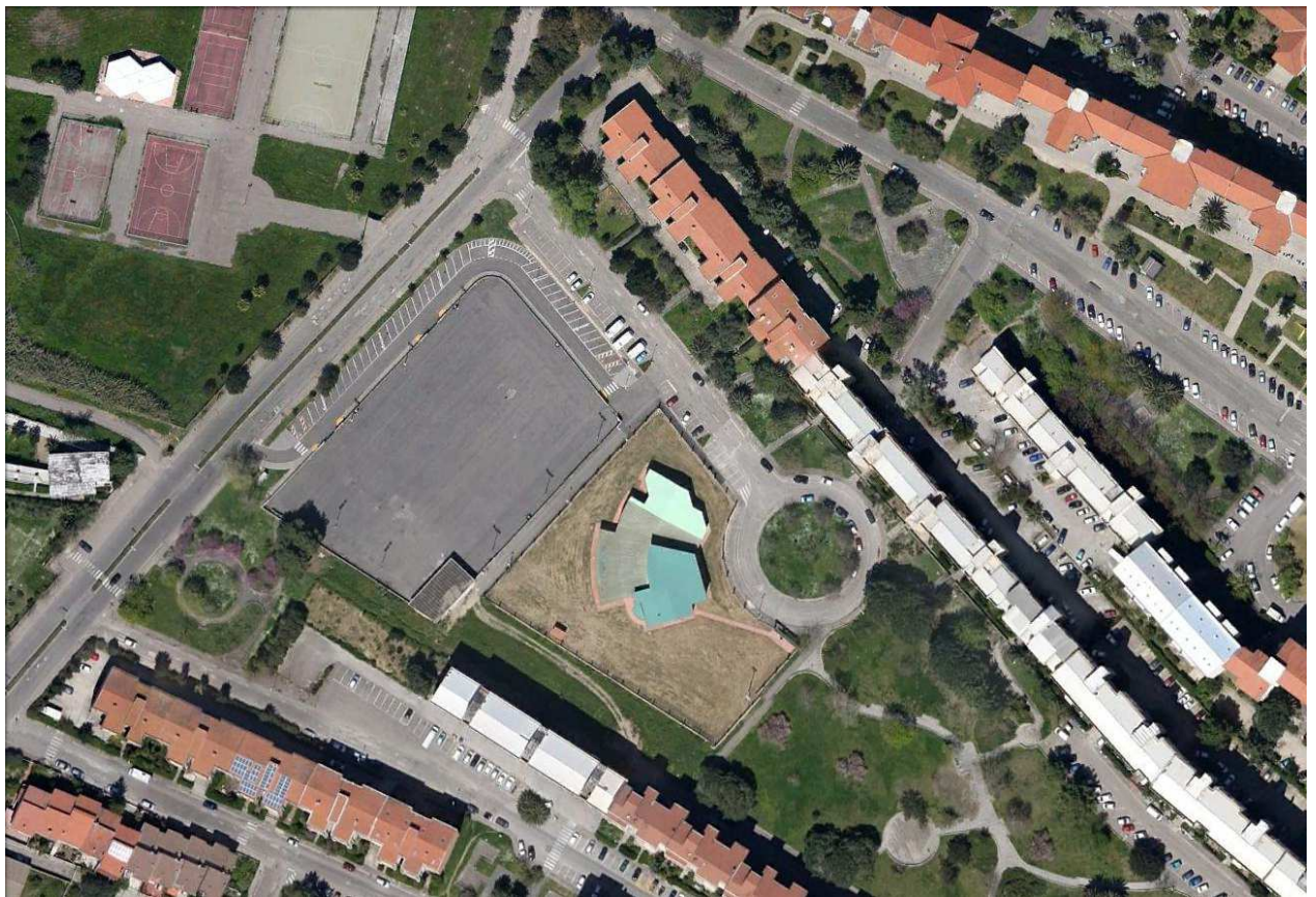
Stralcio vista aerea ludoteca "Torangius".