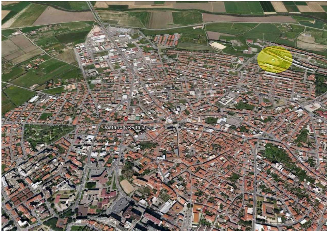
Stralcio vista aerea città di Oristano